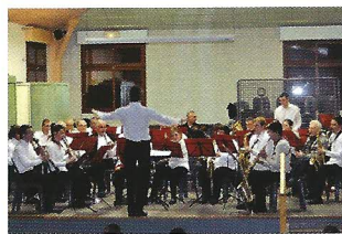
L'harmonie de Cognin