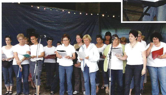
L'Air de rien

Le 11 décembre, pour le concert de Noël, quelques jeunes élèves, principalement montagnolais, de l'école de musique, sont montés sur la scène de la salle des fêtes, suivis de la chorale « L'Air de rien ». Une très belle prestation de l'harmonie de Cognin a terminé cette soirée.